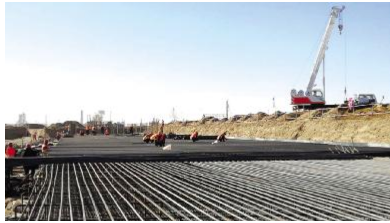
785; <=>?@ABCDEFGHI J 56