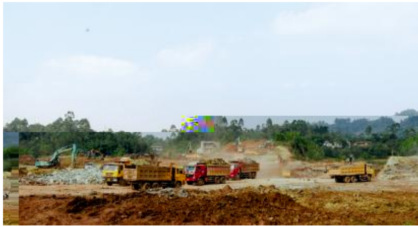
./ 5; <=>?@ABCDEFGHI J 56